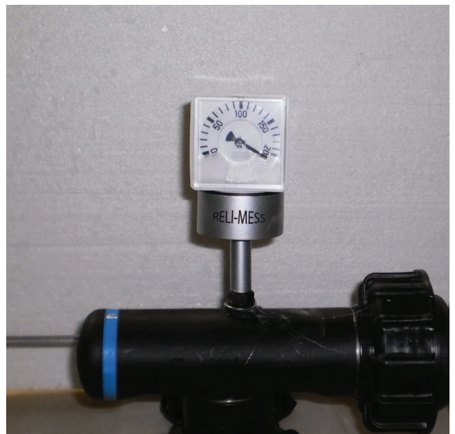
Einbau im Bereich Verbindung Luftleitung Passt Immer

Für beide Einbaumöglichkeiten sind alle Befestigungen und Dichtungen im Lieferumfang enthalten.